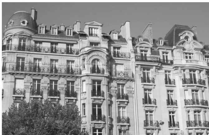
« L'ISF renaît sous la forme d'un avatar affaibli : l'IFI »